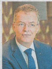
萨米尔维尔德曼：吉隆坡凯宾斯基独一无二，不会又是另一家国际酒店而已。

往下看，8 Conlay 还有 9 层高的裙楼，其中 4 层为休闲商业购物中心。