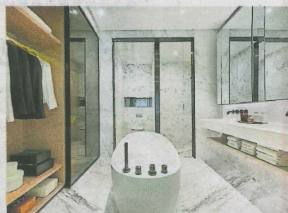
除了水元素，另一个大自然元素为木，图为木元素主人浴室。

不过，刚欢庆 120 周年的凯宾斯基不认同千篇一律的做法，反而相信奢华服务应该不一致，并融入当地文化。