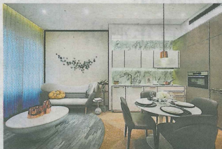
亚洲明星设计师梁志天采用大自然主题装饰室内，图为水元素生活空间。