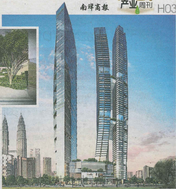
建筑师以凹凸形状的高楼，优美地呈现“八”字形。