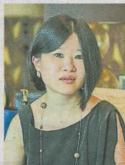
柯盈妃以宜居建筑、设计和个性化服务打造 8 Conlay。

另一栋最高的建筑物就是楼高 68 层的凯宾斯基酒店和酒店公寓，各有 260 间客