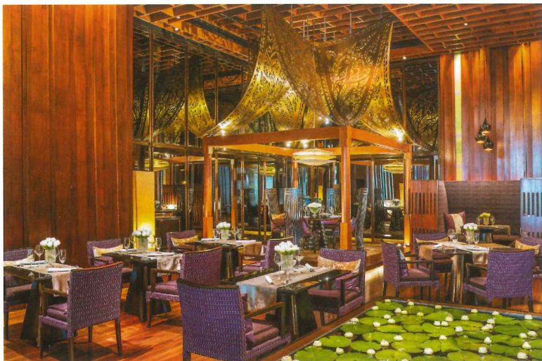
Sra Bua by Kiin Kiin有着华贵而舒适的餐饮空间。