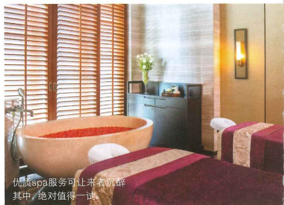
优质spa服务可让来者沉醉其中，绝对值得一试。