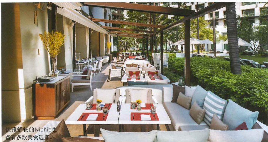
优雅舒畅的Nichie也备有多款美食选择。