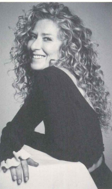
KELLY HOPPEN MBE

酒店集团、星级设计团队、一个异军突起的发展商，首次在马来西亚携手创造垂直村庄，都市有了春天……本刊受邀前往伦敦采访报道。 TEXT TRACY LOW