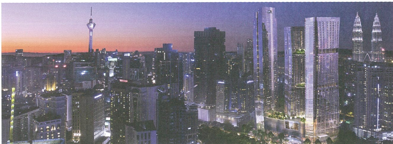
8 Conlay将与市内建筑群形成崭新的城市轮廓线。