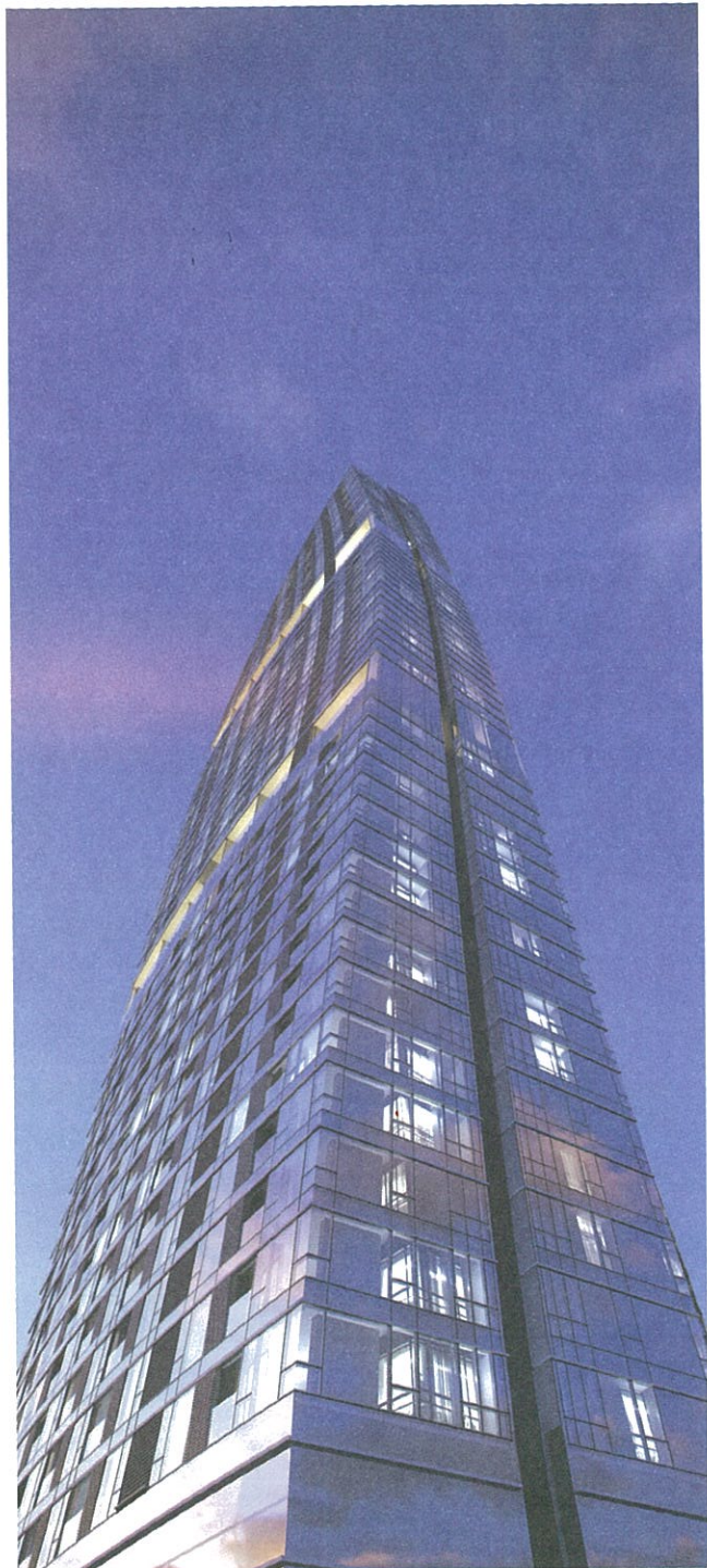
建筑设计强调奢华高尚风格。

Q “越是在地化，即越是国际化”。您是如何看待此风靡全球的“全球在地化”（Glocalization）论调？您的作品拥有强烈的全球性特征，在这个地球村时代，您是否认为应该在作品中表现出一种强烈的在地精神，即由传统性、民族性、地域性与主体性所构成的“马来西亚式建筑”文化？