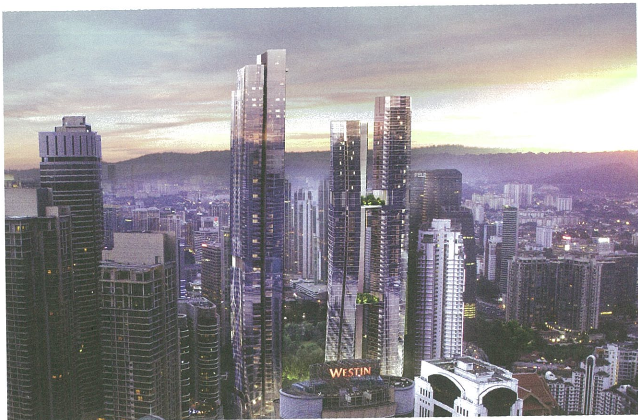
建筑师以凹凸形状的高楼，优美地呈现“八”字形。

Q 决定一件建筑作品的优劣，很大程度上胥视它与使用者的互动关系。以建筑师的立场而言，“使用者”在您的这项作品中究竟有多大的影响，而您在使用者—建筑物—建筑师这三者之间的关系如何取得平衡，并将它体现在这项作品？