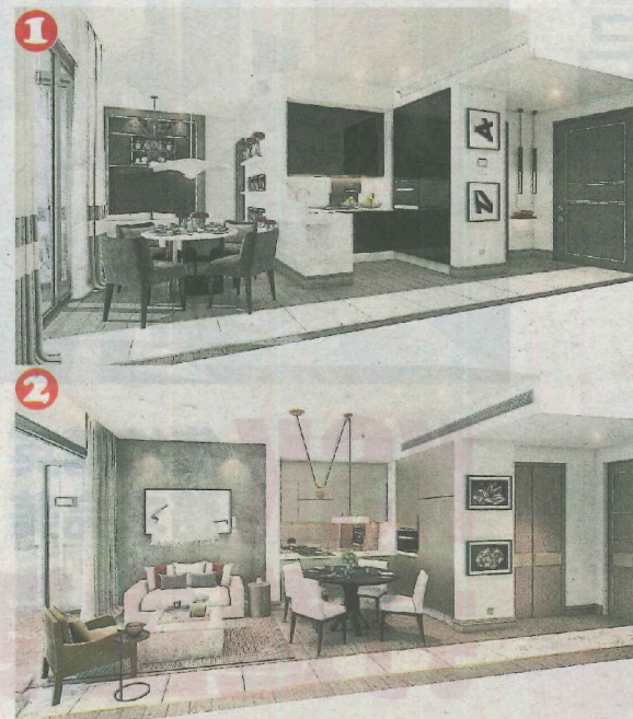
1.都市为概念的客厅与餐厅设计。 2.春天为概念的客厅与餐厅设计。